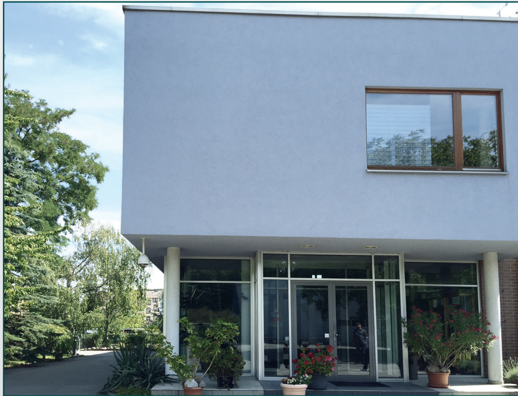
Die pit-cup GmbH – Der CAD-Spezialist ist derzeit mit rund 70 Mitarbeitern an vier Standorten in Deutschland vertreten.